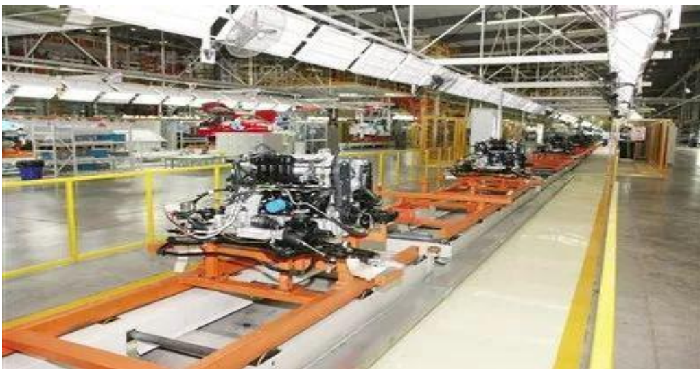
▲位于鄂尔多斯装备制造基地的奇瑞汽车鄂尔多斯分公司汽车生产线

2017年1-11月，我市304项亿元以上重点项目开复工279项，开复工率91.8%，完成投资1070.6亿元，全市计划实施的107项亿元以上重点工业项目完成投资490.6亿元。全市完成固定资产投资3017亿元，居自治区第一位。规模以上工业增加值增速7.3%，比自治区高3.8个百分点。2017年1-10月，非煤产业累计完成固定资产投资1194.7亿元，占工业投资总量的71.5%。实施的32项“七业”重大项目完成投资38.4亿元，开复工32项。一个个拔地而起、蓄势待发的工业建设项目，正拉动鄂尔多斯在新一轮经济发展中跨越赶超，助推鄂尔多斯经济发展提质增效，构筑起城市发展的新高度。