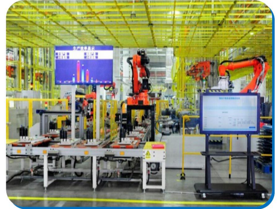
海尔集团家电生产自动化流水线