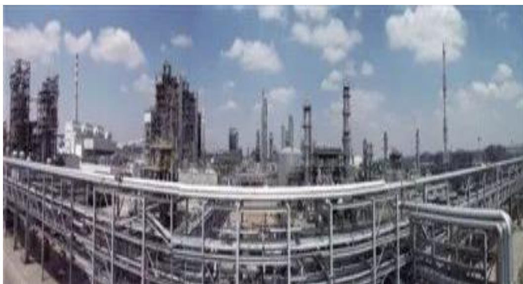
▲神华鄂尔多斯煤制油分公司

一年来，鄂尔多斯市坚持供需两侧发力，引领经济发展新常态，持续扩大有效投资。把项目建设作为重中之重，形成新的项目建设热潮。建立重大项目动态储备、调整机制，制定项目滚动投资计划。创