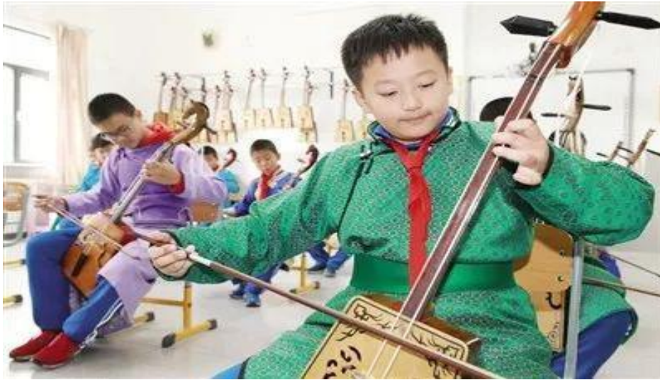
▲鄂尔多斯市不断提升教育教学质量，促进学生全面发展