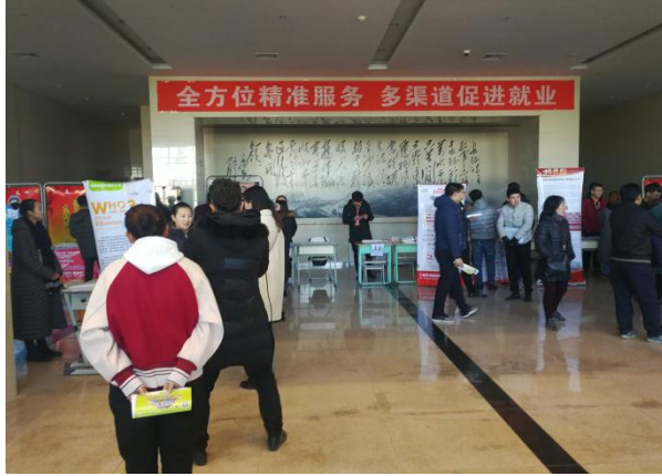
2017年鄂职院冬季大型校园招聘会 1