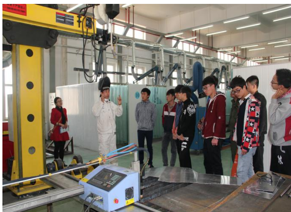
机械工程系学生焊接技能实训