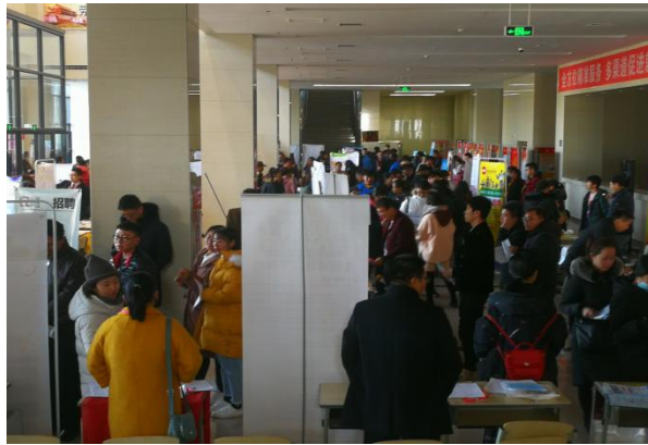
2017年鄂职院冬季大型校园招聘会 2