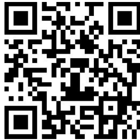
上海财经大学夏令营在线报名