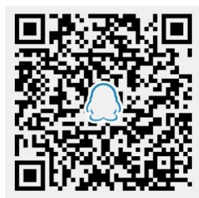
上海财经大学师生交流群

意向考生可扫码加入 QQ 交流群, 院校老师可进群与学生进行直接交流, 并及时发布最新院校活动信息。中国教育在线也可代院校老师进行日常的群管理, 支持全员禁言。